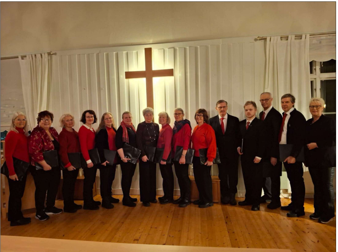
Haparanda-Kalix vokalensemble