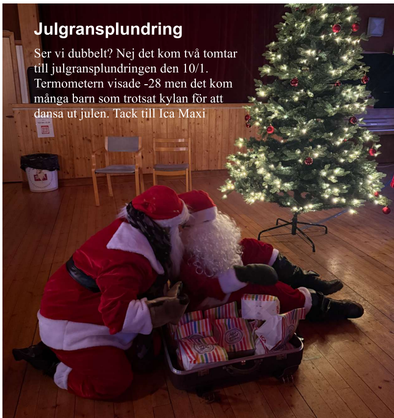
Dubbla tomtar på Folkets Hus

Ser vi dubbelt? Nej det kom två tomtar till julgransplundringen den 10/1. Termometern visade -28 men det kom många barn som trotsat kylan för att dansa ut julen. Tack till Ica Maxi