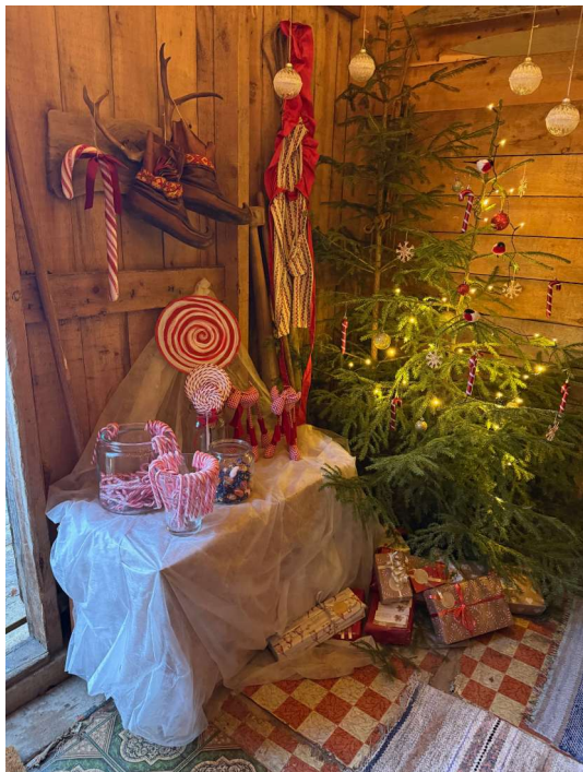
Tomtens karameller.