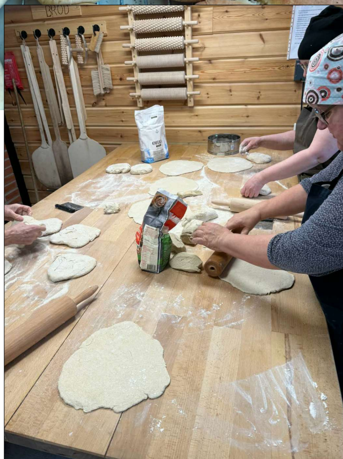
Bakning pågär