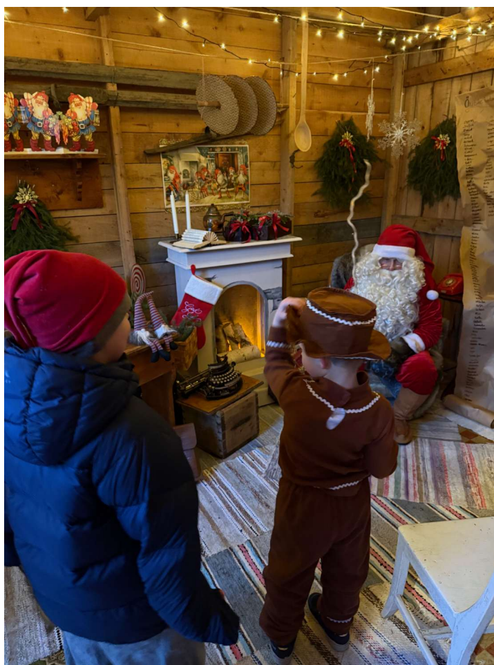
Pirrigt att träffa Tomten.