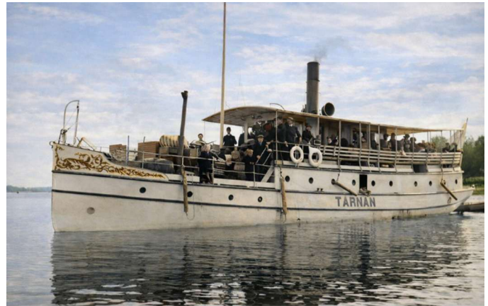
S/S TÄRNAN efter ombyggnad. Fotot är färglagt i efterhand

Den förbättrade kommunikationen med Seskarö var inte enbart till nytta. Det gjorde det också enklare för en del "löst folk" att ta sig till ön. Antalet slagsmål och andra ordningsstörningar ökade. Många av dem kunde direkt kopplas till resande som kom med TÄRNAN. Sågverken begärde att två polismän skulle tillsättas på ön. NK skrev i oktober 1900.