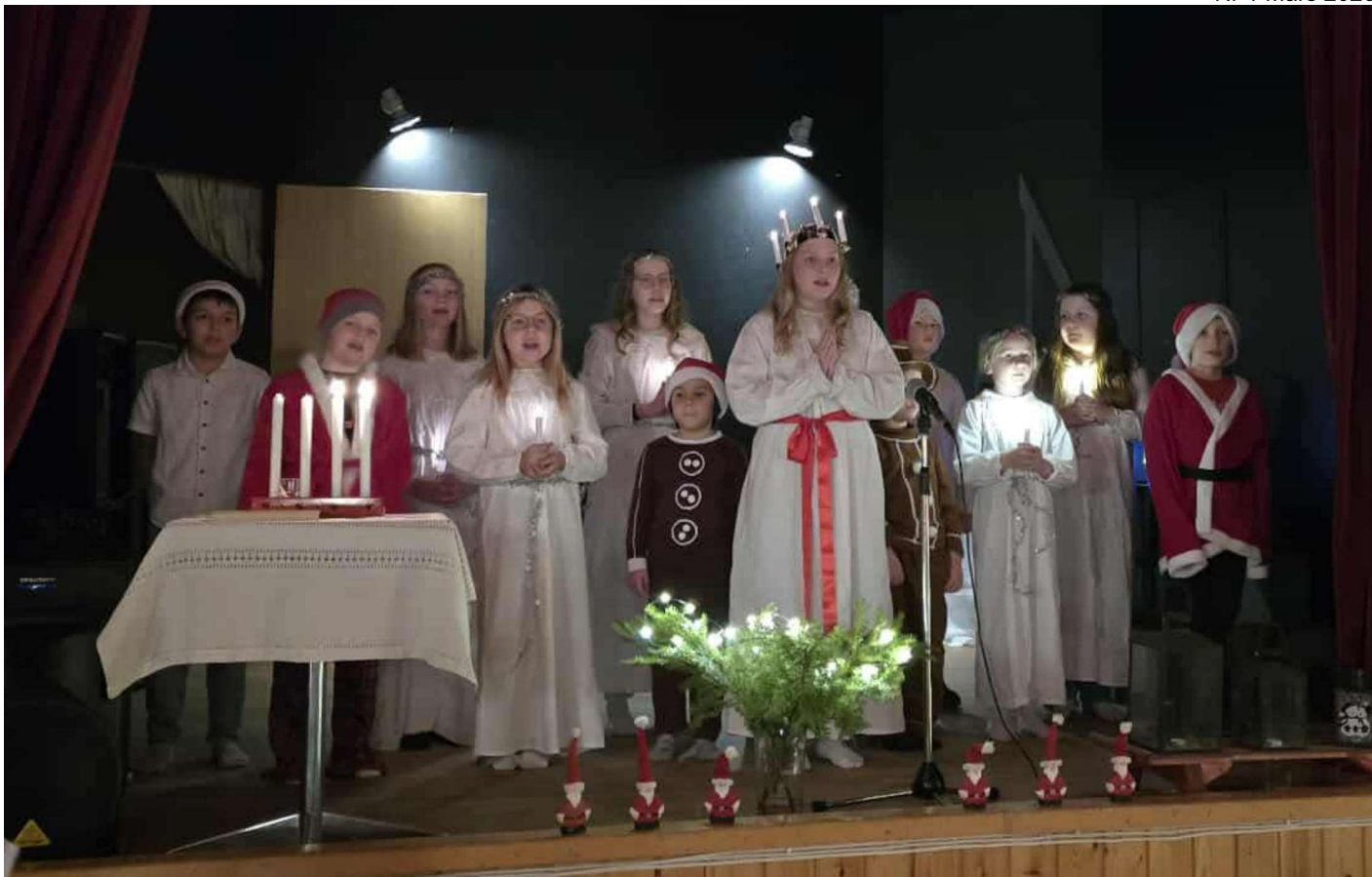
Seskarös egna luciatåg 2025