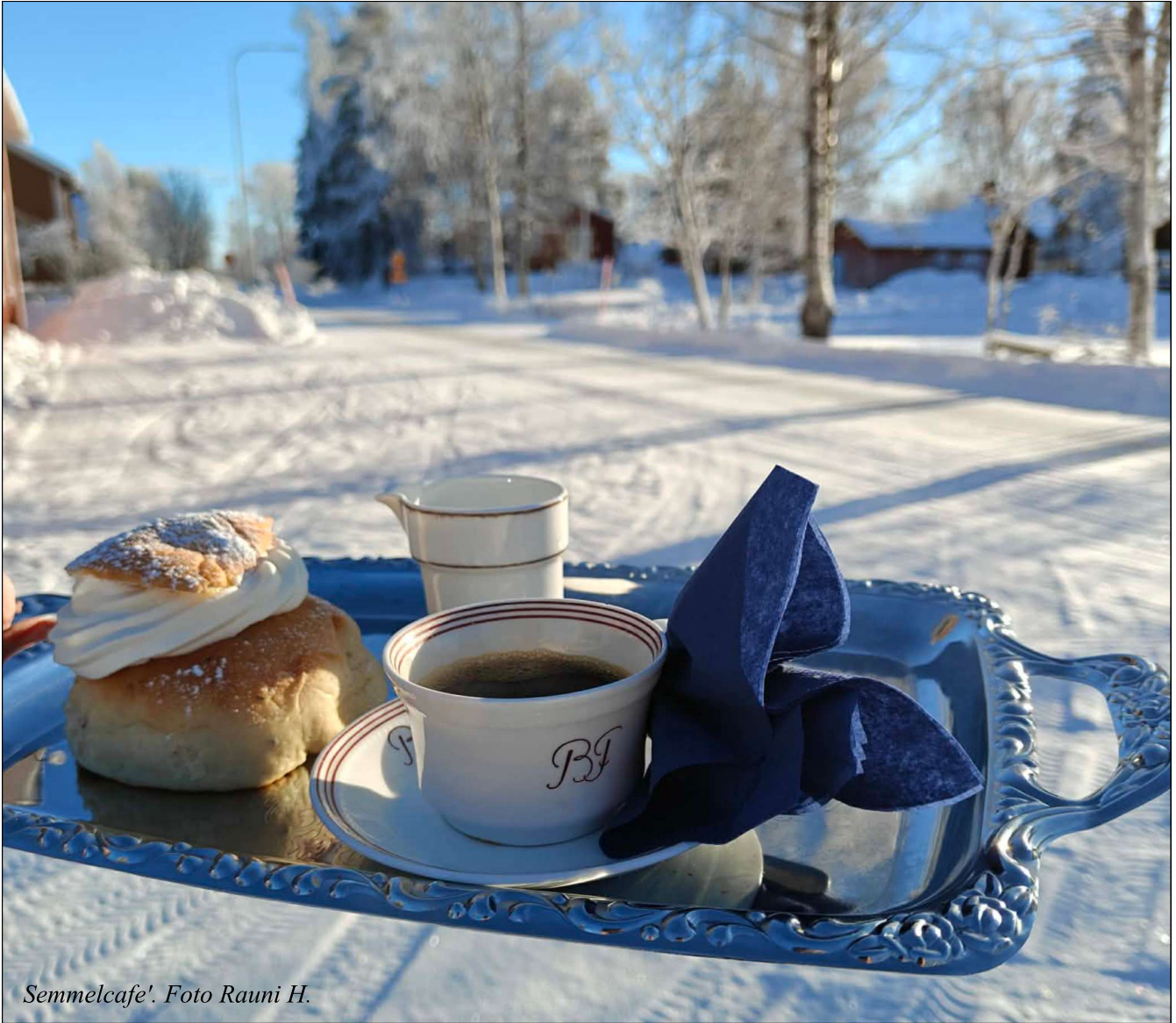
Semmelcafé'.