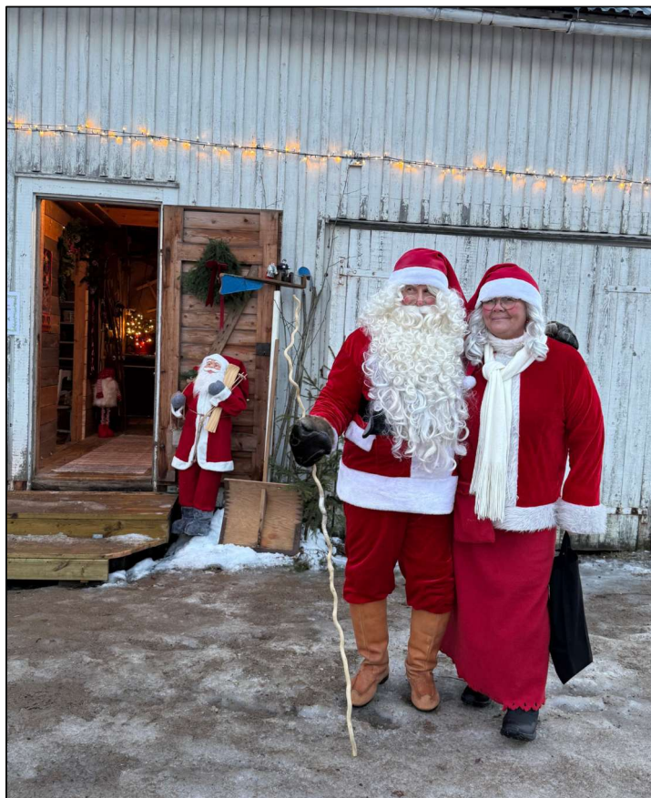
Tomtefar & tomtemor.