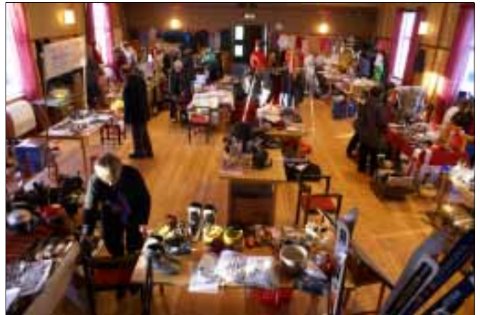
Förhoppningsvis ett återkommande arrangemang med stor loppis på Seskarö under en hel vecka.