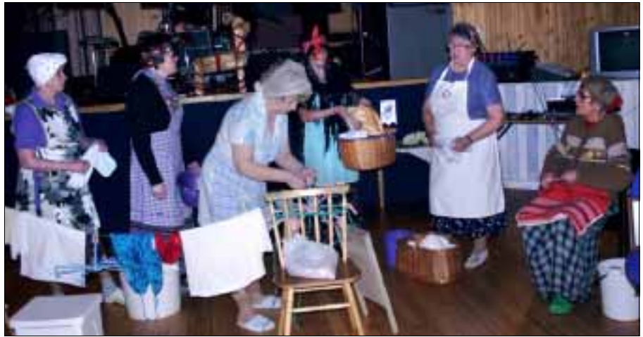
PROmissarna gav en föreställning på finska.