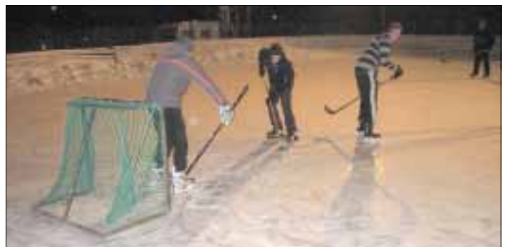
Ovan: Hockeymatch pågår. Nedan: allmän åkning...