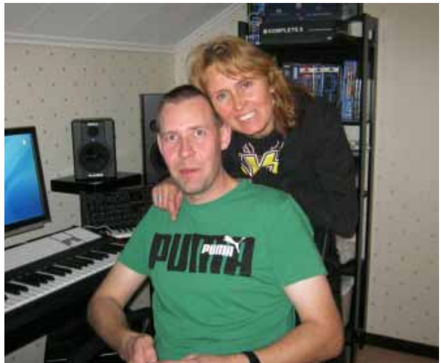
Två som provat lyckan.