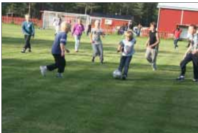
Full fart i benen på de unga spelarna på fotbollsplanen